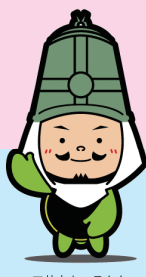
三井寺キャラクター ペンペン

後援(会場)/天台寺門宗 総本山 三井寺(園城寺) 滋賀県大津市園城寺町246 TEL(077)522-2238 後援/滋賀県・大津市・びわ湖大津観光協会・浜大津観光協会 滋賀県パルーンアート協会・待(まつ)コミュニケーション